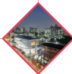
選定為構建首爾校園社 區的事業單位