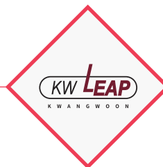
選定為支持大學創新的 自律協議大學事業單位