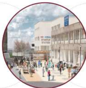
选定为构建首尔校园社区 的事业单位