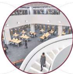
具备高尖端技术 ICT技术 的中央图书馆